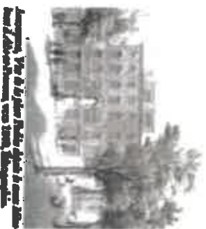
Alcazar-Vieux, Vue de la place Public, que l'on aperçoit de la maison des Bœuf à Alcazar-Vieux, vers 1835, Philippe Marreau.

Signé et daté en bas à gauche Marreau 35