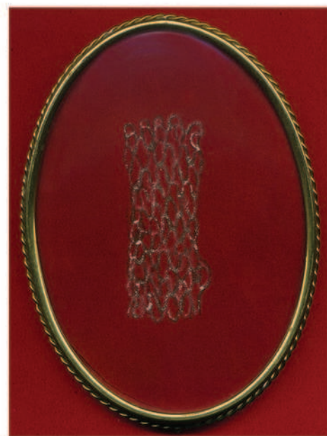
14X19 CM (PAIRE)