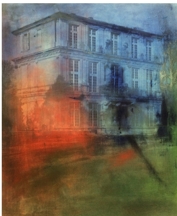
Le Palais d'amour , 2015, altotype marouflé sur toile, 100 x 81 cm

Le Palais d'amour , qui n'est autre que le Pavillon de Vendôme, est une œuvre que Alfons ALT a réalisé quelques jours avant l'inauguration de l'exposition pour rendre hommage à ce joyau de l'architecture de notre ville. Les couleurs vives et le rouge font référence à l'amour et à la légende de la Belle du Canet et du Duc de Vendôme. Cette œuvre évoque notre ville entre patrimoine et création.