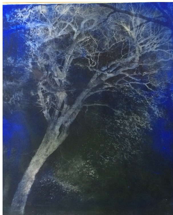
Yewa ou Chêne Vendôme , 2015 altotype marouflé sur toile, 150 x 120 cm

Une série d'arbres, sculpturaux et graphiques sont un écho aux arbres majestueux du parc du Pavillon de Vendôme. Pour l'exposition l'artiste a également créé une oeuvre intitulée Yewa ou Chêne Vendôme , photographies prises dans le parc de Vendôme. Il a superposé un If taillé en boule typique des jardins à la française, aux dimensions remarquables avec un chêne majestueux très graphique.