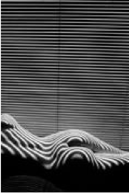
Nu zébré, 2013 - tirage argentique, 60 x 50 cm

Passant les siècles la peinture et la sculpture vont représenter la femme plus ou moins nue selon les époques et dès ses premiers temps la photographie va servir la recherche des proportions parfaites. Le nu apparaît très tôt dans l'œuvre de Lucien Clergue. Dès 1956, il se lance dans la célébration du corps féminin.