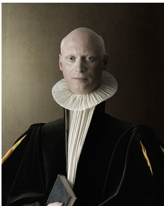
Christian Tagliavini - Bartolomeo , série 1503 – 2010, laserchrome sur diasec, 85 x 68 cm

Cette exposition présentait une relecture, un face à face entre les portraits peints du XVIIIe siècle issus de la collection du Pavillon de Vendôme en résonance avec les photographies de Christian Tagliavini. L'œuvre choisie de Christian Tagliavini « Bartolomeo » entre en parfaite résonance avec une œuvre faisant partie des collections de peinture du Pavillon de Vendôme « Louis XIII enfant ».