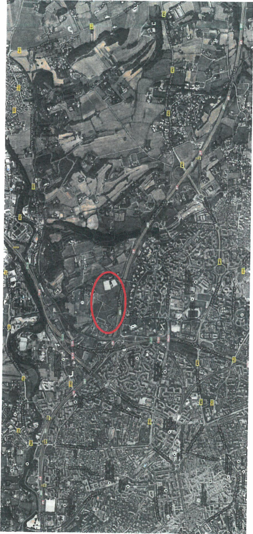
Localisation du projet