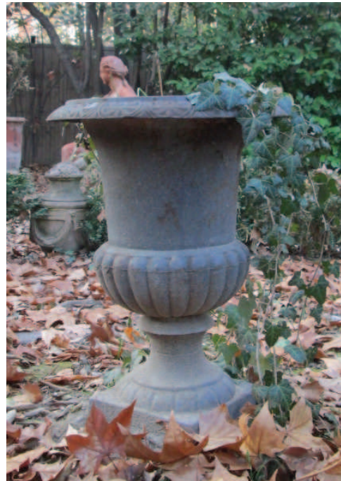
photographies du vase 2