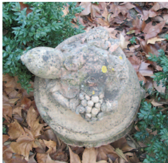
photographie du couvercle vue de dessus