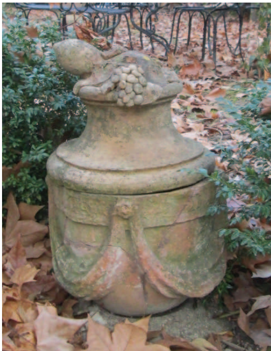
photographie du pot complet