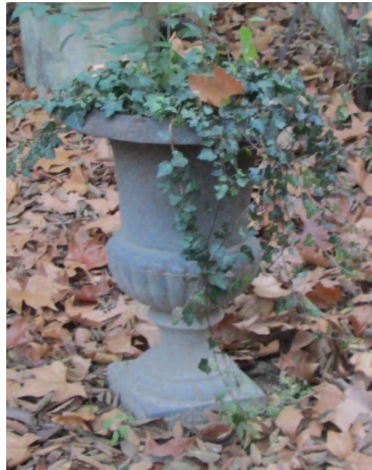
photographie du vase 1