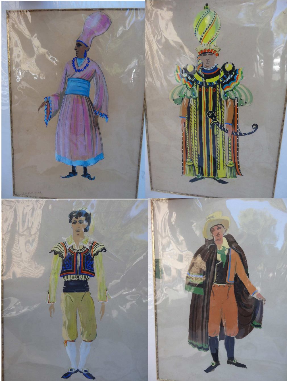
Maquettes planes de costumes pour l'Italienne à Alger de Rossini par Matias