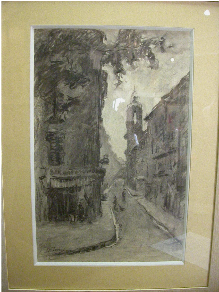
dessin au fusain, signé, daté 1918 hauteur 49 cm – longueur 31 cm