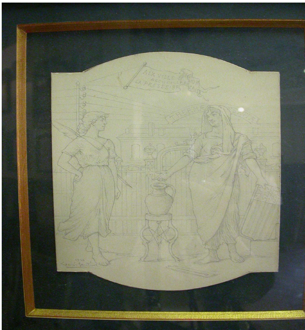
dessin au crayon cadre de bois doré signé Louis Gautier, daté 1922 hauteur : 21,5 cm – longueur : 16,5 cm

« Aix ville d'eau accueille la presse française »