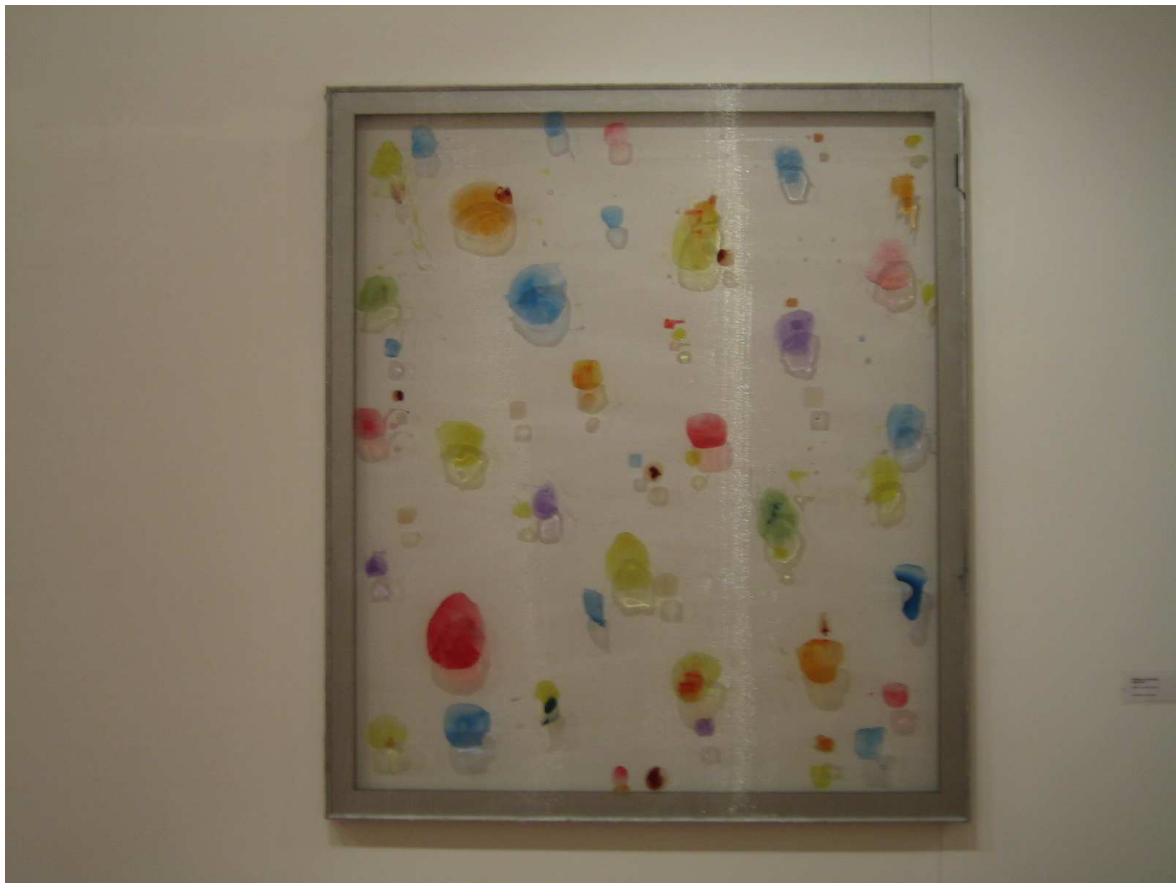
Peinture abstraite (2009)