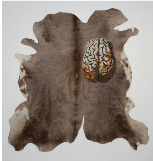
Byrsa, 190 X190 cm, cuir peau poil et mosaïque de perles de verre

Après l'assassinat de son mari par Pygmalion son frère, Didon (Élyssa), fille de Bélus, roi de Thyr, s'enfuit pour gagner la pointe nord de l'Afrique. Elle conclut un marché avec les autochtones berbères : acheter autant de terres qu'une peau de vache peut en contenir. Elle découpe cette peau en fines lanières puis elle encercle un territoire pour bâtir la citadelle de Byrsa et fonder Carthage . La cité de Carthage surnommée Empire de la mer règnera sur la Méditerranée au IV e siècle av JC.