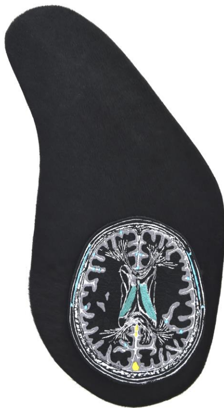
Coupe du cerveau