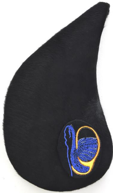
Testicule et épидидyme