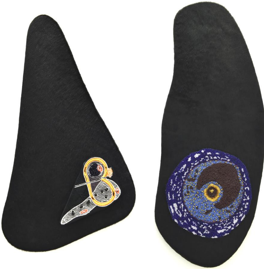
Anneaux tendineux communs