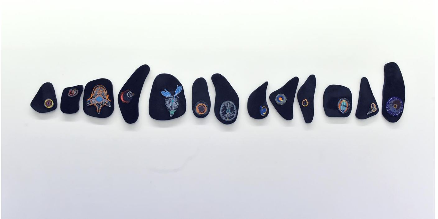
La petite suite de Byrsa, 2015-2016 Hauteur maximale 70 cm, longueur variable Cuir maroufflé sur bois et broderie maroufflée sur cuir.

La petite suite de Byrsa est une série de 13 pièces alignées sur une horizontale. Chaque pièce comporte une broderie rehaussée de perles de verre, maroufflée sur un cuir peau poil noir.