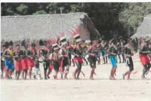
Illustration 1: TAP_8288