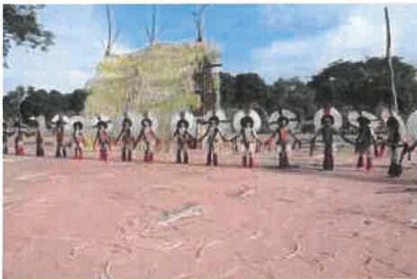
Karaka Tocantins (66)