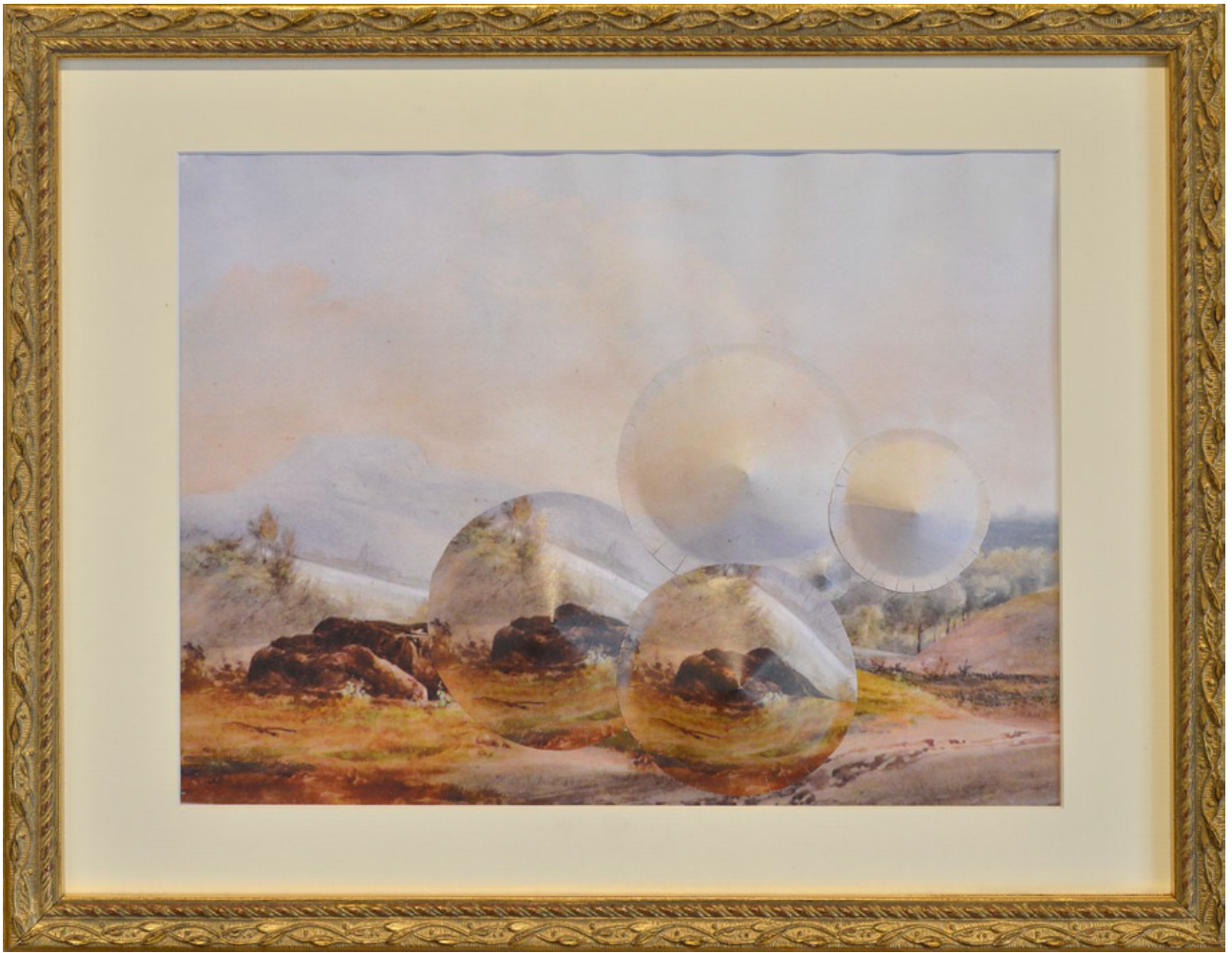
Paysage de collection #4 (couple et cheval) 2017, papier découpé à partir d'une œuvre reproduite issue de la collection du Pavillon de Vendôme – 22 x 30 cm / encadrement 32 x 41 cm