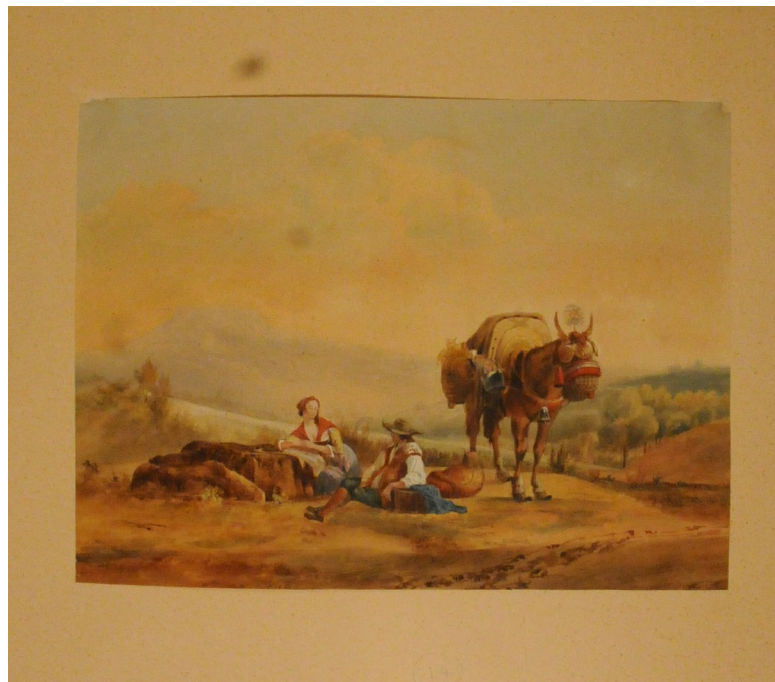
Couple de paysans assis au bord d'un chemin avec un âne harnaché , aquarelle avec rehauts peinture à l'huile sur papier, h. 22 x 29, 7 cm, collection du Musée du Pavillon de Vendôme