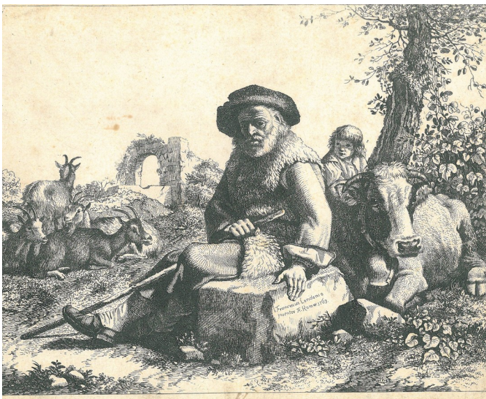
Berger assis sur un rocher accompagné d'un enfant, d'une vache couchée et de chèvres, au second plan, ruine, Milieu du 18 e s., gravure, h. 19 x 24, 3 cm, collection Musée du Pavillon de Vendôme