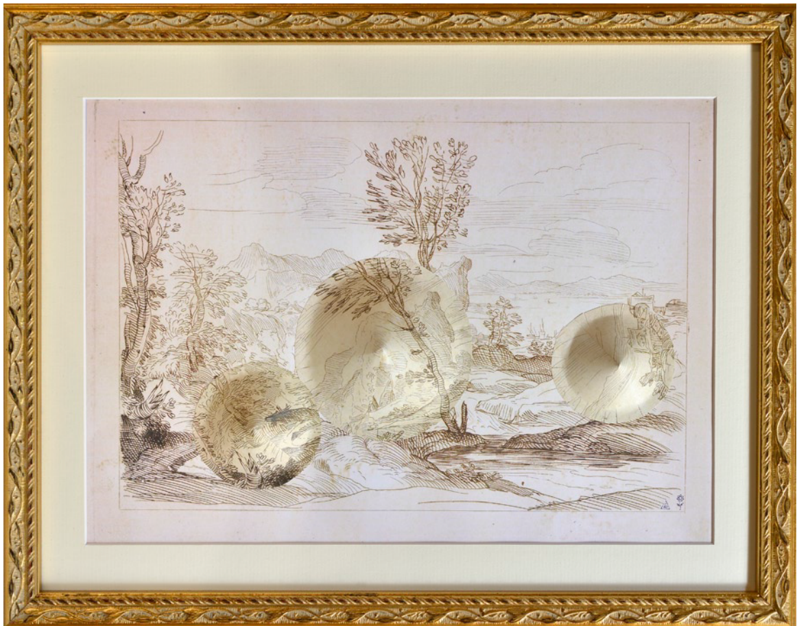
Paysage de collection #5 (traits arbre) 2017, papier découpé à partir d'une œuvre reproduite issue de la collection du Pavillon de Vendôme – Aix-en-Provence (13) œuvre 23,5 x 32,5 cm / encadrement 32 x 41 cm