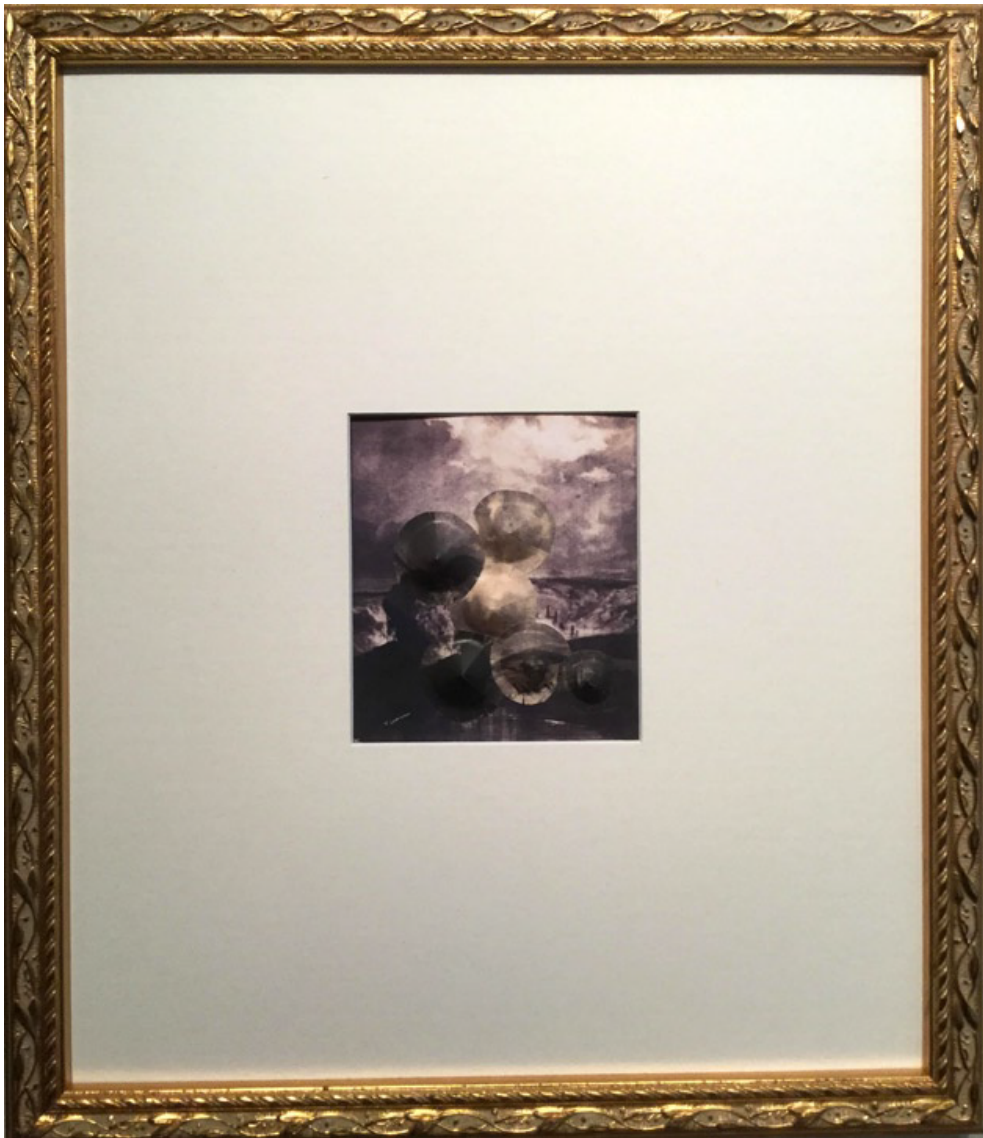
Paysage de collection #1 (rocher) 2017, papier découpé à partir d'une œuvre reproduite issue de la collection du Pavillon de Vendôme, œuvre 11 x 9,5 cm / encadrement 37 x 32 cm