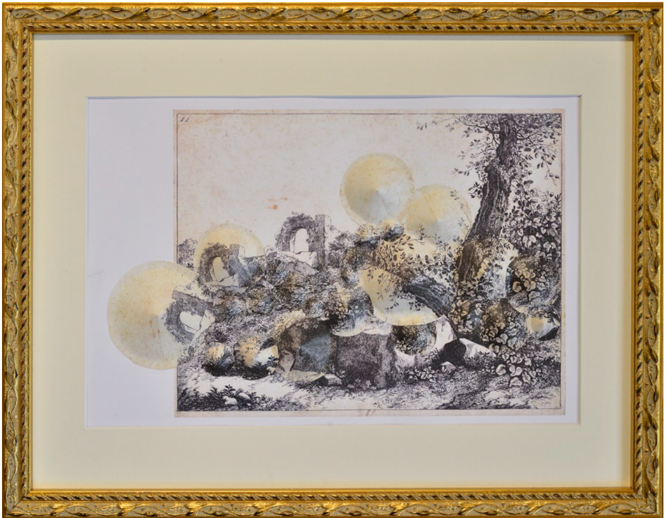
Paysage de collection #3 (les bergers) 2017, papier découpé à partir d'une œuvre reproduite issue de la collection du Pavillon de Vendôme – Aix-en-Provence (13) œuvre 27 x 19 cm / encadrement 32 x 41 cm