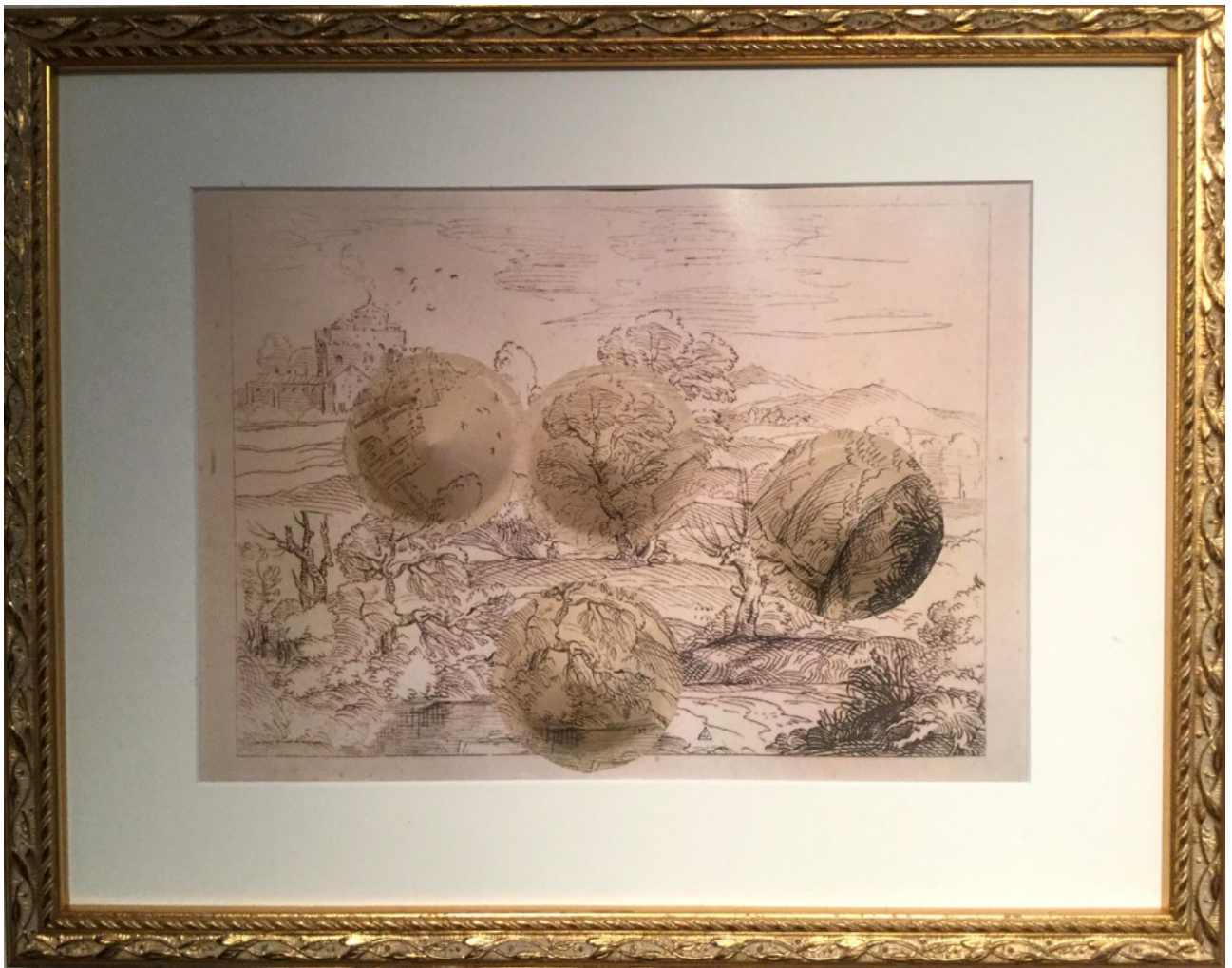
Paysage de collection #6 (château) 2017, papier découpé à partir d'une œuvre reproduite issue de la collection du Pavillon de Vendôme – 20 x 28 cm / encadrement 32 x 41 cm