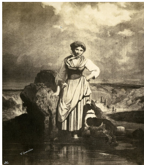
Photographie noir et blanc reproduisant une oeuvre de V. Camoin, jeune fille au bord de mer, début du 19e s., h. 11 x 10 cm, collection Musée du Pavillon de Vendôme