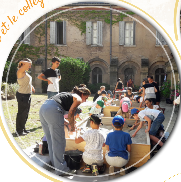
La place et le collège des Prêcheurs